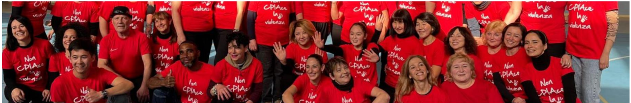
LA FOTOGRAFIA DEL CPIA

Condividi | Vedi azioni Argomenti: [Parli opportunità]