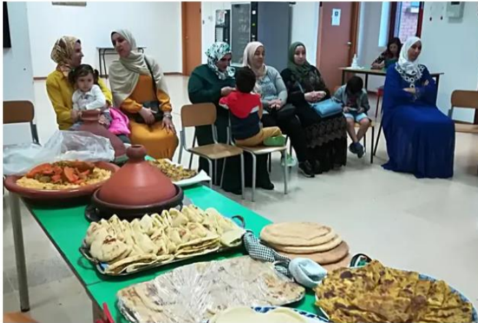
Donne marocchine al Cpia

Una trentina di iscritti, uomini, donne comprese una decina di marocchine che sono arrivate da tempo a Maracalagonis e che ora hanno deciso di imparare, alla scuola del Cpia - centro provinciale istruzione degli adulti - la lingua italiana.